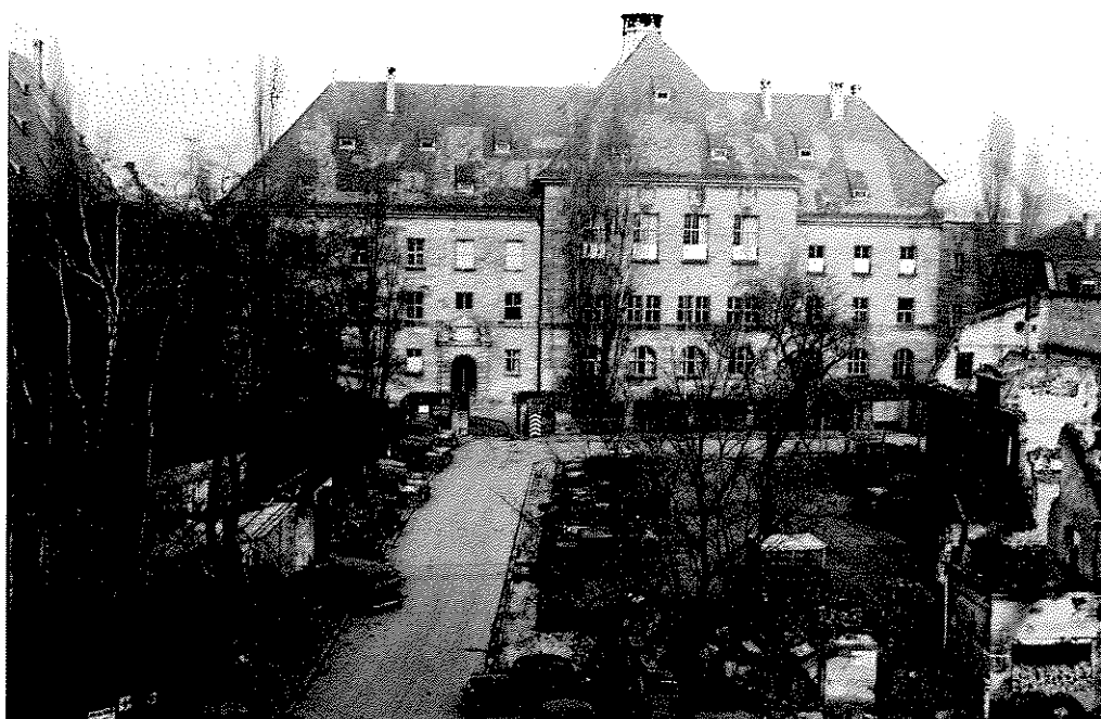
Ala oriental del Palacio de Justicia (East Wing)